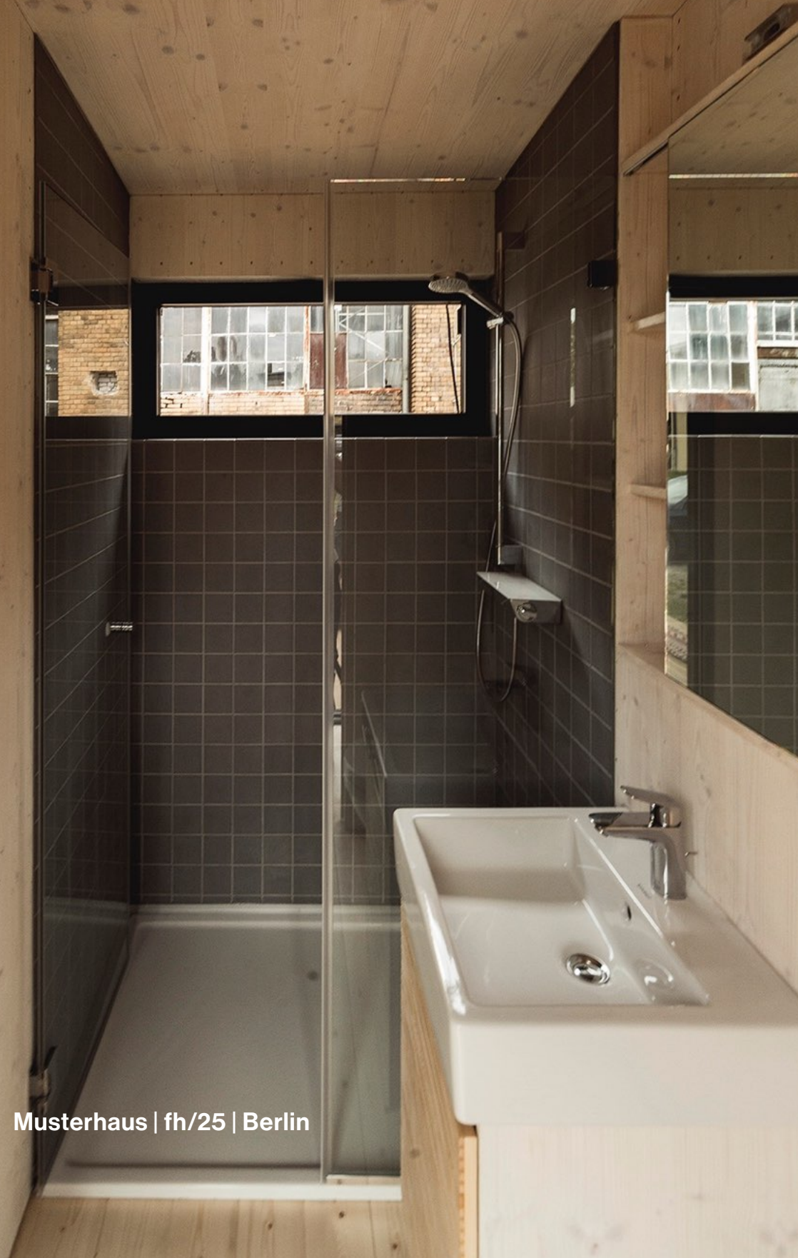
Musterhaus | fh/25 | Berlin